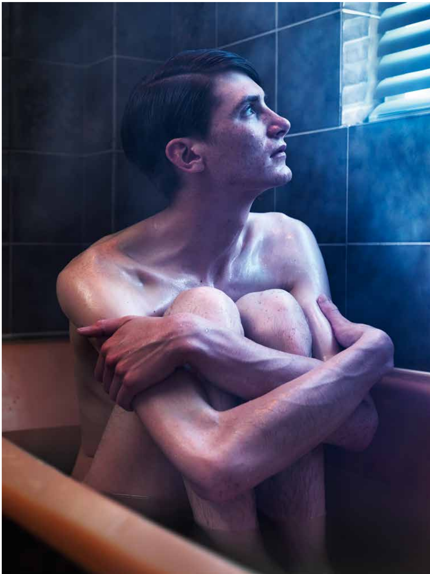
Mother, uit de serie A 2011 ODDITY