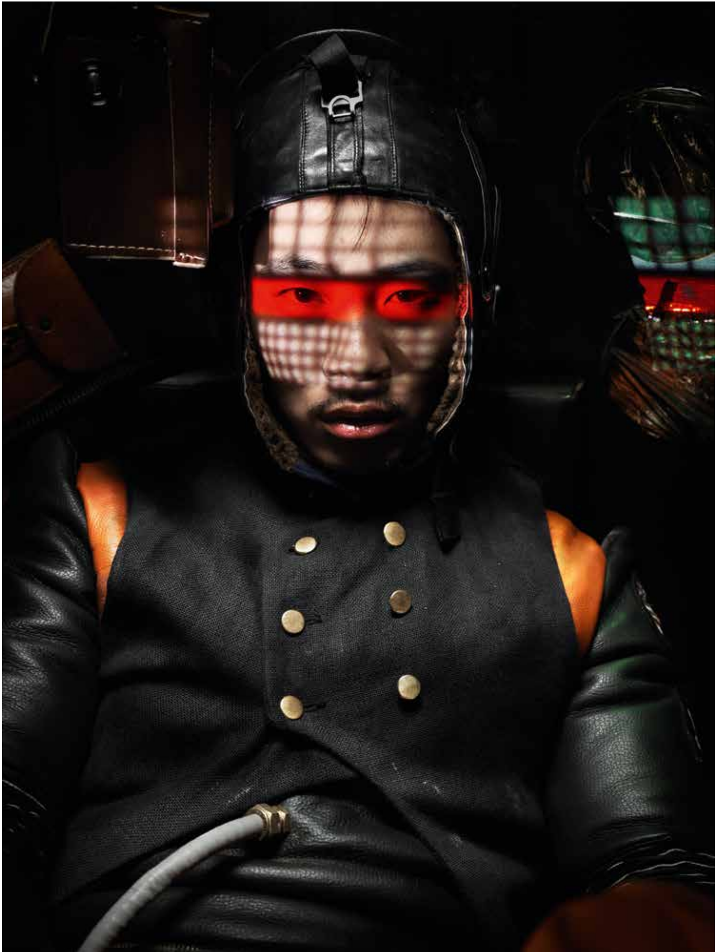
Epilogue, uit de serie A 2011 ODDITY