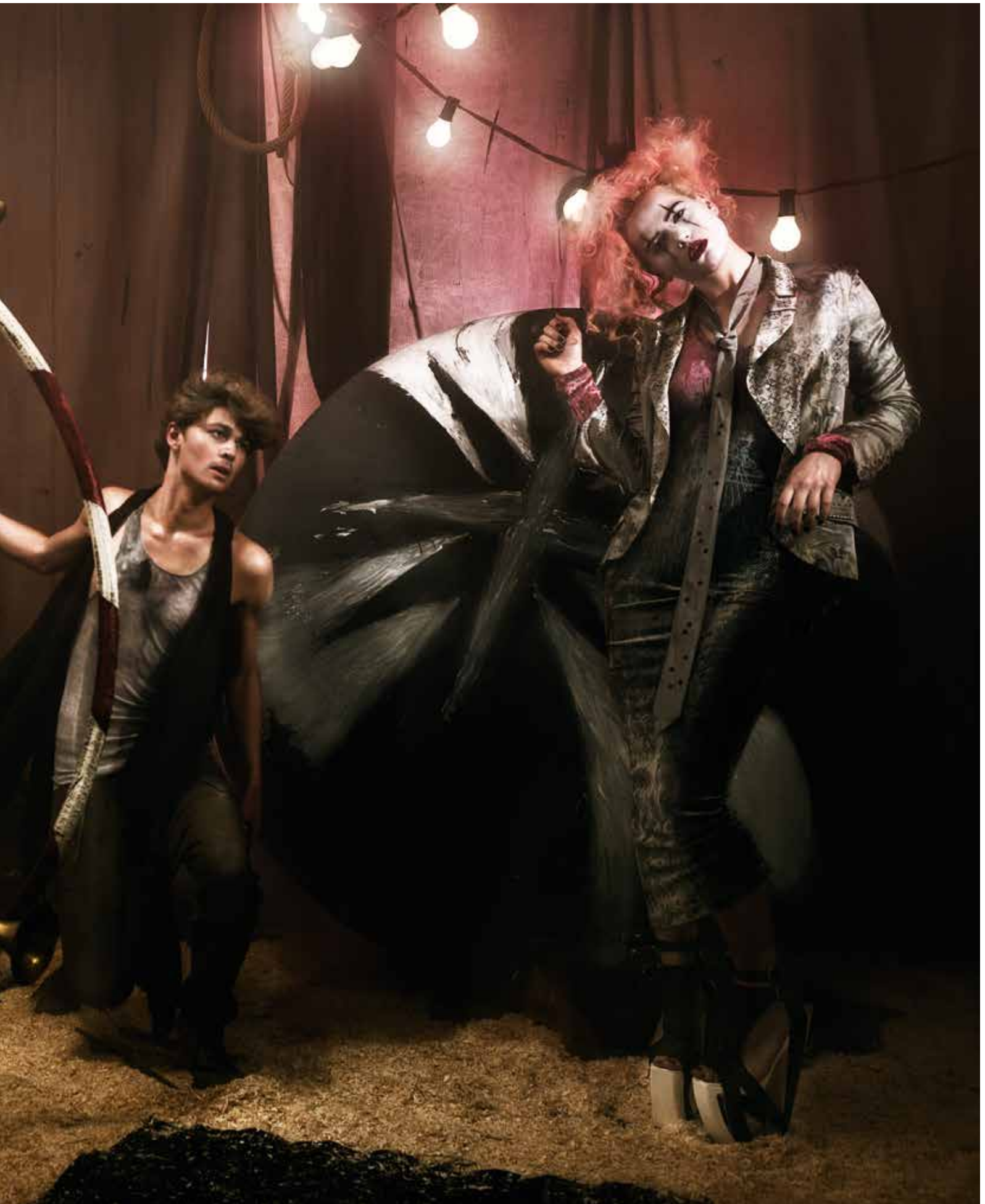
Carnivale, uit de reportage Fashion Circus